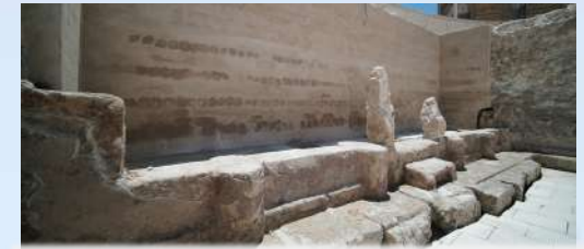
Κατάλοιπα της νότιας πρόσοψης του Υπογείου Α, τα οποία ανακαλύφθηκαν το 2021

Η ενότητα αυτή αποτελείται από δύο ταφικούς θαλάμους. Ο πρώτος θάλαμος φιλοξενεί τέσσερα loculi (ταφικές κόγχες) σε κάθε του μακρά πλευρά, που κατανέμονται μεταξύ ιωνικών ημικίωνων. Οι προσόψεις ιωνικού τύπου των loculi σφραγίζονταν αρχικά με πλάκες. Ο οπισθότοιχος του θαλάμου αποτελεί ταυτόχρονα τη μνημειακή πρόσοψη του δευτέρου θαλάμου: μια πλατιά θύρα που περιστοιχίζεται από ιωνικούς ημικίονες με τύμπανο στην κορυφή, και ψευδοπαράθυρα σε κάθε πλευρά. Τον δεύτερο, κατά πολύ μικρότερο, θάλαμο καταλαμβάνουν δύο σαρκοφάγοι σε μορφή