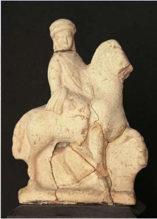
Νεαρός ιππίας με μακεδονική ενδυμασία από το νεκροταφείο του Σάτμπυ. Ελληνορωμαϊκό μουσείο της Αλεξάνδρειας 10615